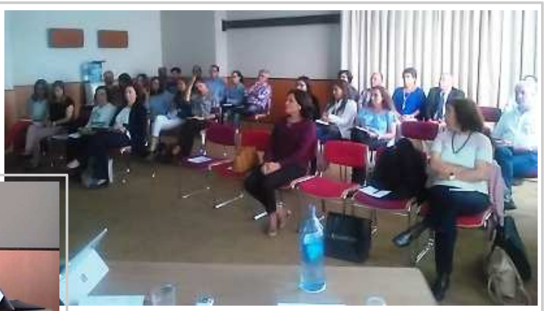
Sessão de Lisboa

O seminário teve duas sessões, a 24 de Outubro no Porto e a 25 de Outubro em Lisboa, e contou com a presença de 53 técnicos.