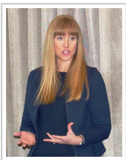
Sessão de Lisboa