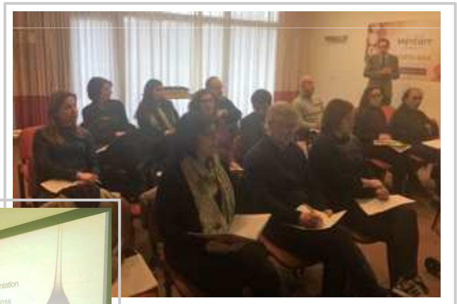
Sessão do Porto

Conductivity improves for applications in the solvent industry