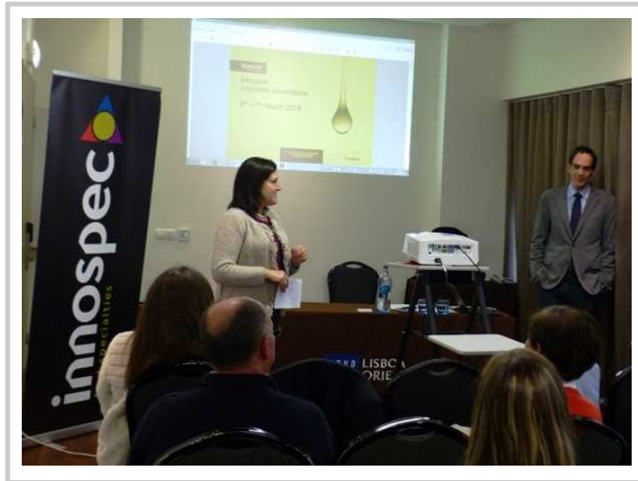
Sessão de Lisboa